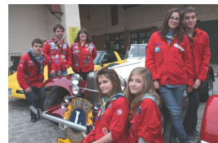
Avec le soutien des scouts de France