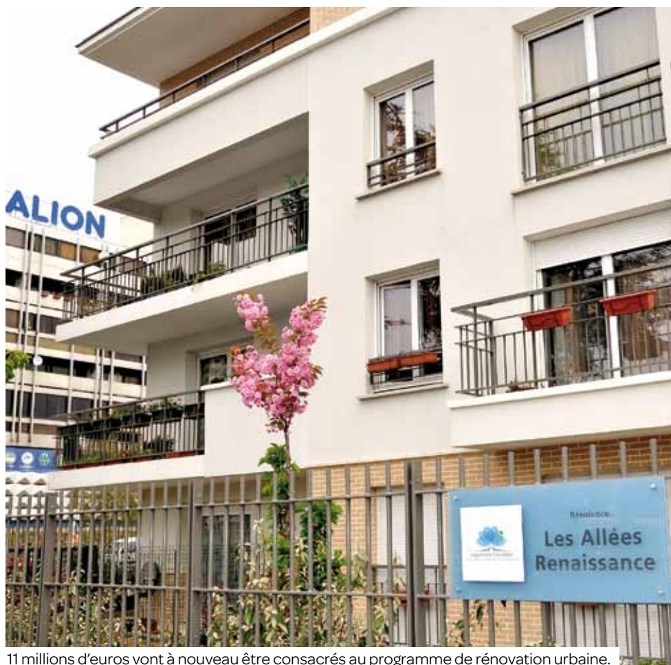
11 millions d'euros vont à nouveau être consacrés au programme de rénovation urbaine.

La ville consacre une part importante de son budget à son programme d'équipement, notamment en ce qui concerne la rénovation urbaine.