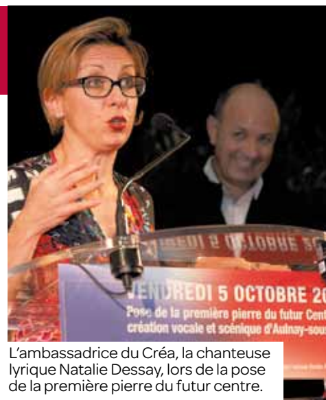
L'ambassadrice du Créa, la chanteuse lyrique Natalie Dessay, lors de la pose de la première pierre du futur centre.