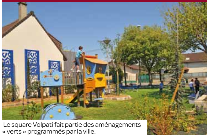
Le square Volpati fait partie des aménagements « verts » programmés par la ville.

Dans le cadre du combat écologique qui s'impose aux communes, Aulnay poursuit ses projets de rénovation des bâtiments énergivores, tout en diminuant à nouveau la consommation en éclairage public. La ville s'engage aussi à respecter des normes plus strictes en matière de construction (cf. la charte des promoteurs signée au mois de décembre). La ville va cette année également favoriser les transports en commun avec le projet du pôle gare, qui comprend la rénovation du souterrain Anatole-France, de la gare routière et des aménagements publics qui les accompagnent.