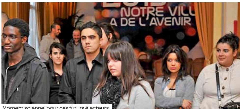
Moment solennel pour ces futurs électeurs.

vraie rupture avec l'adolescence, plus que les études ou le simple fait d'avoir 18 ans. En tant que citoyennes, nous avons des droits et des devoirs ; voter, c'est un peu des deux. Avoir la possibilité de voter, c'est avoir une prise sur notre vie future. C'est le début d'une vie active, d'adulte avec des lois à respecter, des responsabilités, et aussi la possibilité de faire changer des choses. Notre voix, notre opinion peuvent être entendues. On ne compte plus pour du beurre. »