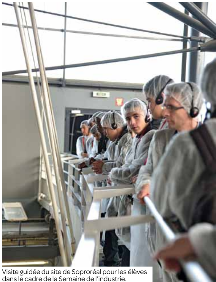
Visite guidée du site de Soproréal pour les élèves dans le cadre de la Semaine de l'industrie.

À la faveur de la Semaine de l'industrie, L'Oréal a ouvert ses portes à une classe de seconde du lycée Voillaume. Une visite enrichissante pour ces jeunes qui s'orientent vers des métiers dans une filière industrielle.