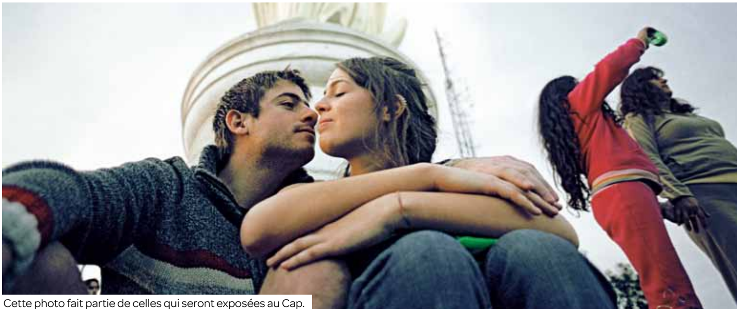
Cette photo fait partie de celles qui seront exposées au Cap.

Véritable ode à ce sentiment qui fait battre nos cœurs, l'exposition photos « Parle-moi d'amour » rappellera aux spectateurs que le printemps est bel et bien là. Cet événement, organisé avec le bureau d'aide aux victimes d'Aulnay et la direction des affaires culturelles, s'étendra en plusieurs lieux du 9 avril au 18 octobre.