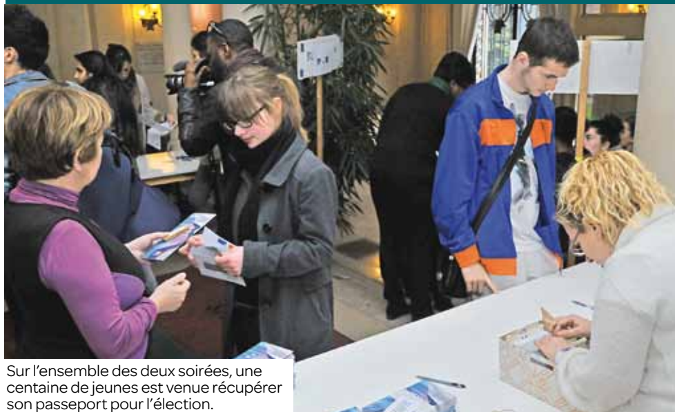
Sur l'ensemble des deux soirées, une centaine de jeunes est venue récupérer son passeport pour l'élection.