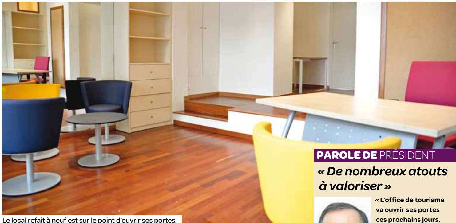
Le local refait à neuf est sur le point d'ouvrir ses portes.

Création de l'association, mise en place du conseil d'administration, feu vert du conseil municipal, local aménagé, l'Office de tourisme d'Aulnay est prêt à ouvrir ses portes, boulevard de Strasbourg.