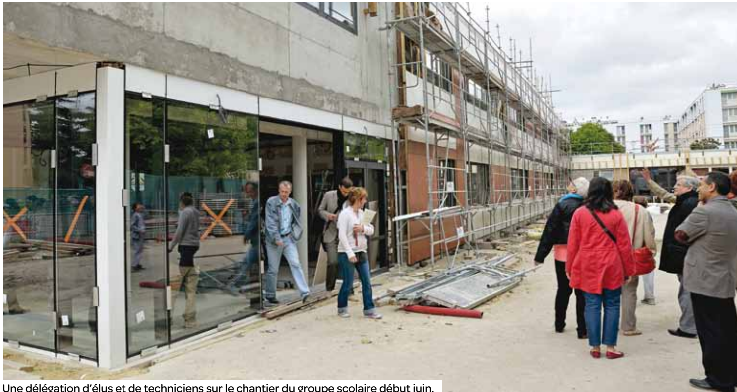
Une délégation d'élus et de techniciens sur le chantier du groupe scolaire début juin.

Les travaux de finition s'achèvent à la maternelle du groupe scolaire Ambourget, qui rouvrira en septembre. Cet été, place aux interventions dans l'élémentaire et au réaménagement de la sente des écoliers.