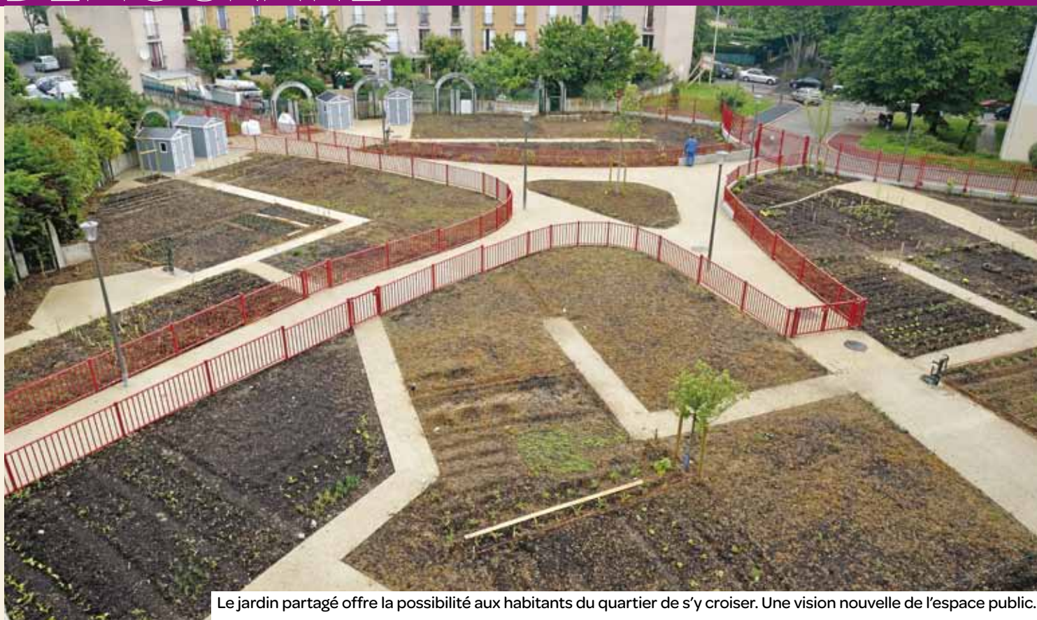
Le jardin partagé offre la possibilité aux habitants du quartier de s'y croiser. Une vision nouvelle de l'espace public.