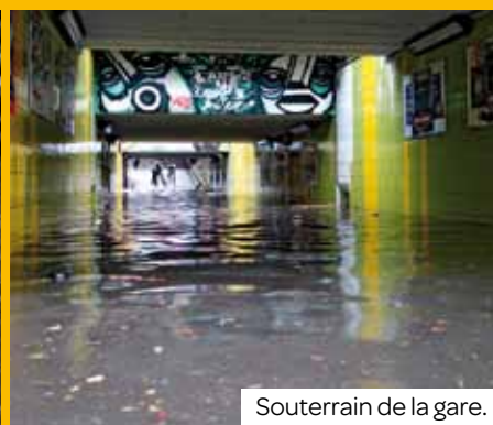
Souterrain de la gare.

Le maire Gérard Ségura a sollicité l'État, via la préfecture, pour que l'état de catastrophe naturelle soit décrété, ce qui ouvrirait droit à des garanties supplémentaires en faveur des sinistrés. Plus d'informations sur le www.aulnay-sous-bois.fr Une fréquence cinquantenaire En effet, selon les informations transmises par Météo France, l'événement pluvieux aura duré au total 3h51, avec une lame d'eau moyenne sur le département de 29,9 mm. Aulnay est la deuxième ville la plus touchée de la Seine-Saint-Denis, avec un cumul de 65,4 mm. D'autre part, la quasi-totalité de ce cumul est tombée en