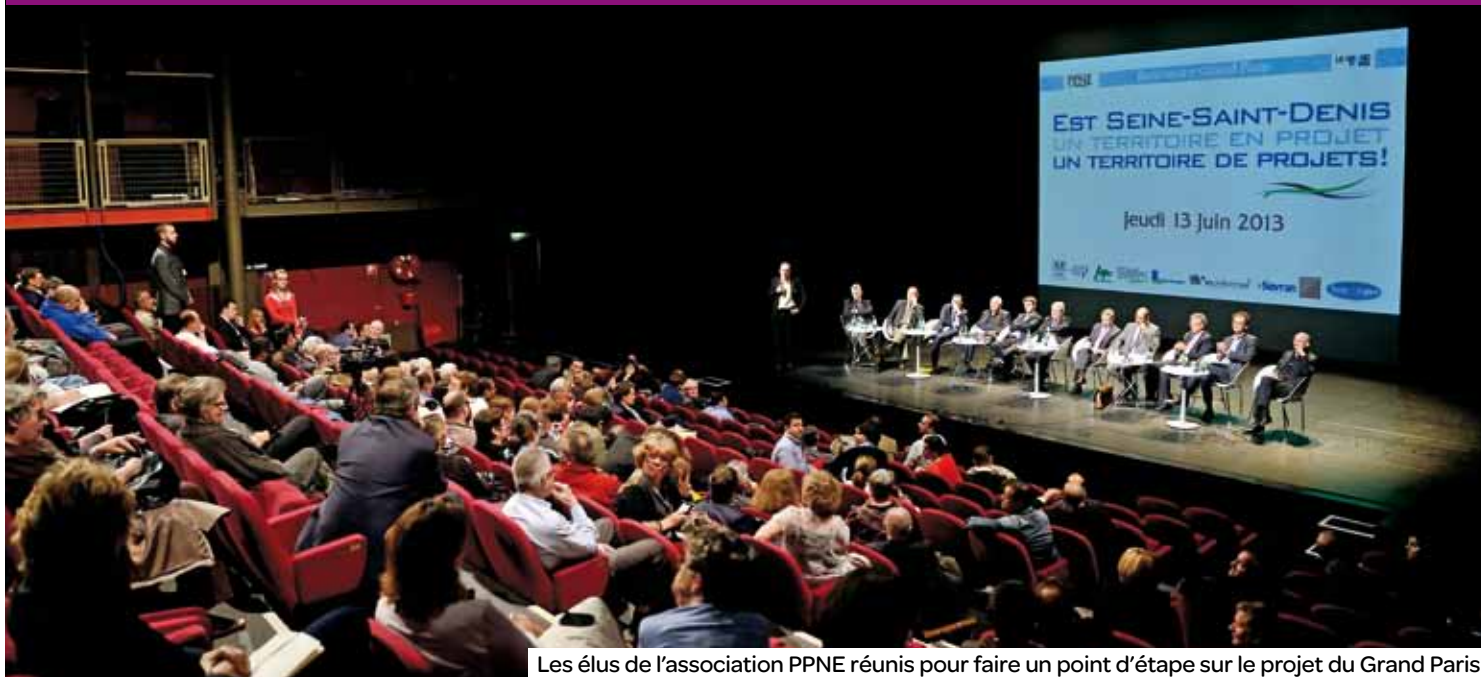
Les élus de l'association PPNE réunis pour faire un point d'étape sur le projet du Grand Paris.