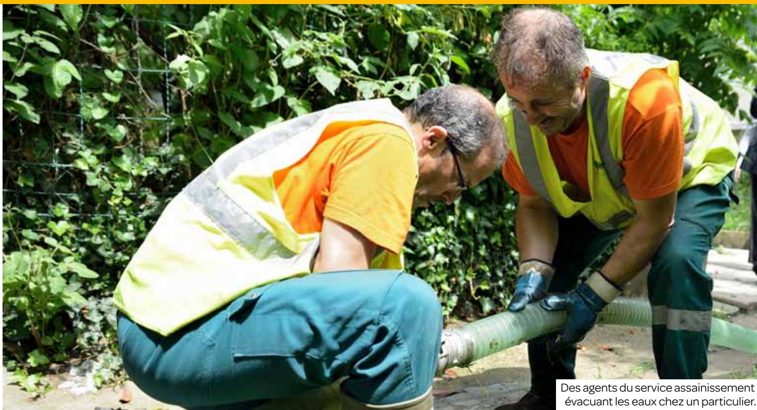
Des agents du service assainissement évacuant les eaux chez un particulier.