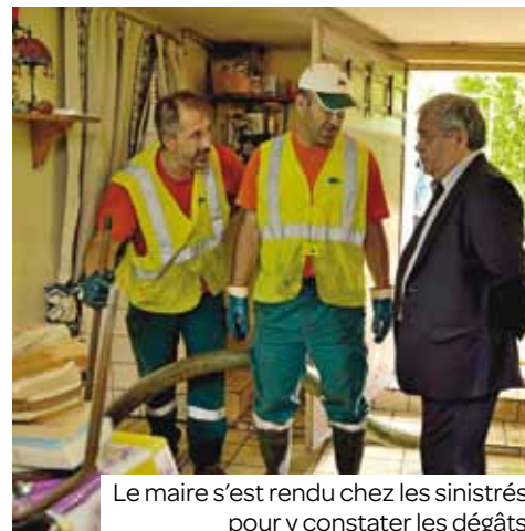
Le maire s'est rendu chez les sinistrés pour y constater les dégâts.