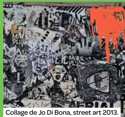
Collage de Jo Di Bona, street art 2013.

Depuis deux ans, la direction des affaires culturelles consacre une journée à la promotion des arts urbains. Genre artistique souvent décrié car assimilé à la dégradation, le Street art a su, petit à petit, conquérir son public. Aulnay a fait le choix de présenter des artistes novateurs dans leur milieu, qui développent de nouvelles formes artistiques, créatives et ludiques, et de promouvoir différentes formes d'expression telles que le light-painting, le graffiti ou le collage. L'exposition consacrée à l'Urbex, qui permet de voir la ville sous un autre angle, s'inscrit dans la continuité de cette découverte de nouvelles formes d'expressions artistiques urbaines.