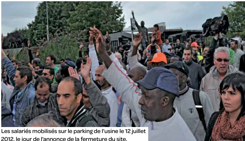
Les salariés mobilisés sur le parking de l'usine le 12 juillet 2012, le jour de l'annonce de la fermeture du site.

Le SIA – syndicat majoritaire – dénonce une inégalité de traitement autour des conditions de départ entre grévistes et non-grévistes. Un recours devant le tribunal de grande instance de Paris n'est pas exclu.