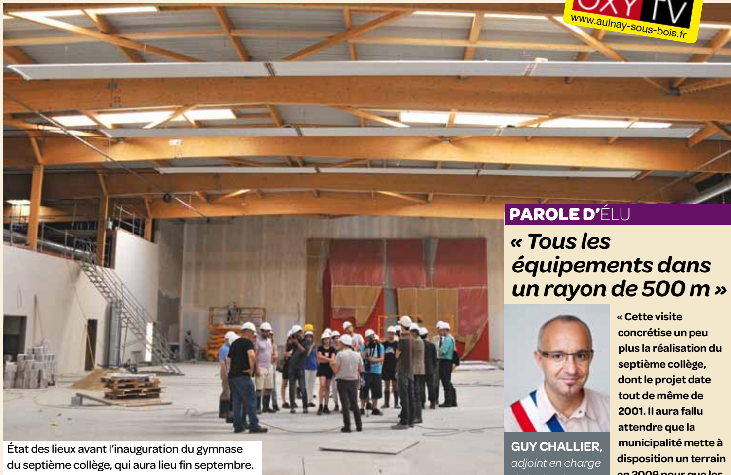
État des lieux avant l'inauguration du gymnase du septième collège, qui aura lieu fin septembre.