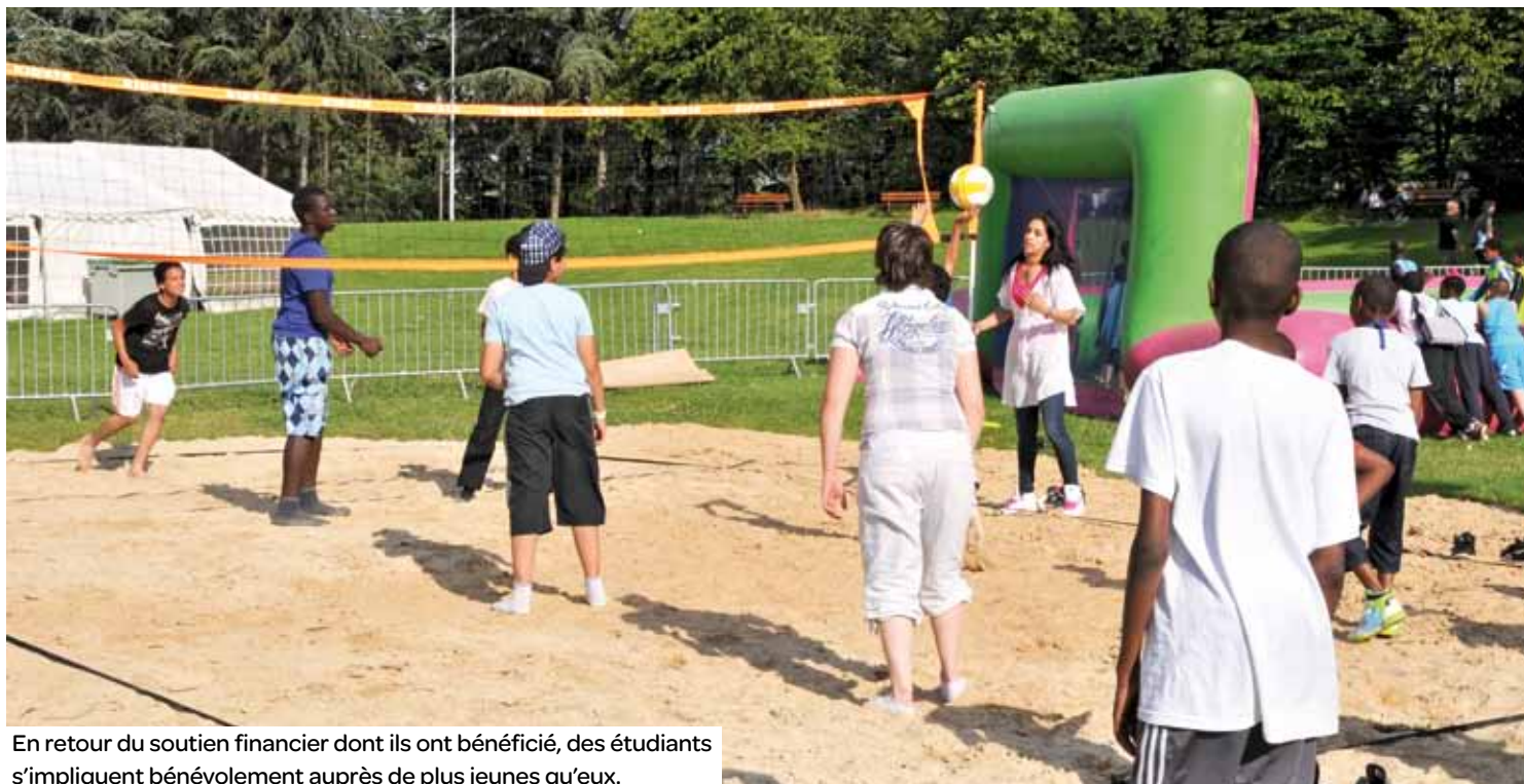
En retour du soutien financier dont ils ont bénéficié, des étudiants s'impliquent bénévolement auprès de plus jeunes qu'eux.

Plusieurs étudiants aulnaysiens ayant bénéficié du dispositif d'aide aux projets jeunes vont travailler cet été avec les centres de loisirs ou au parc Ballanger dans le cadre de l'Été à Ballanger.