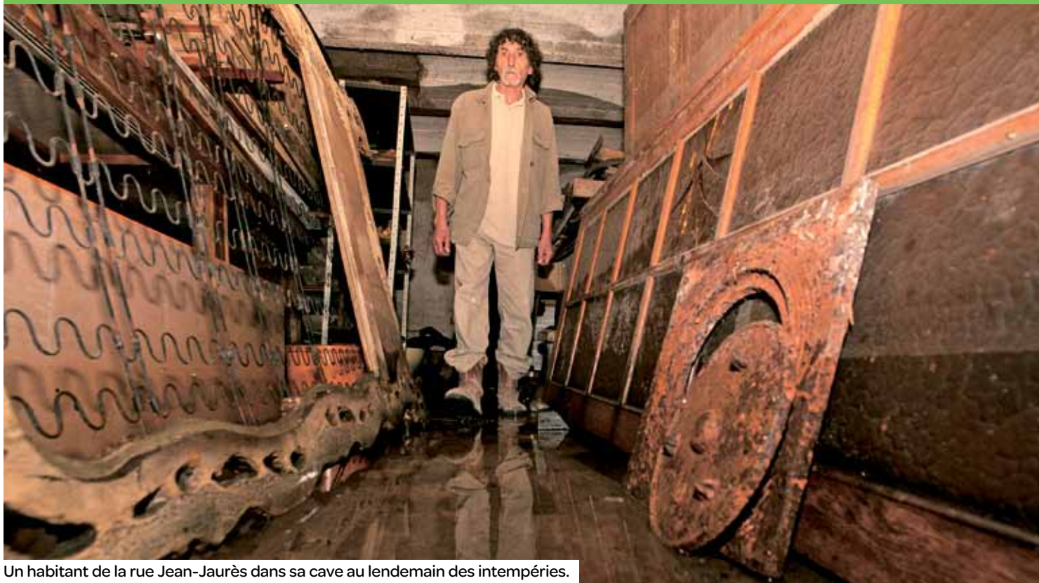
Un habitant de la rue Jean-Jaurès dans sa cave au lendemain des intempéries.