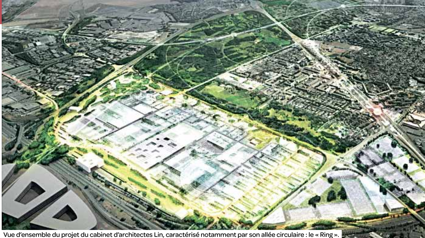
Vue d'ensemble du projet du cabinet d'architectes Lin, caractérisé notamment par son allée circulaire : le « Ring ».