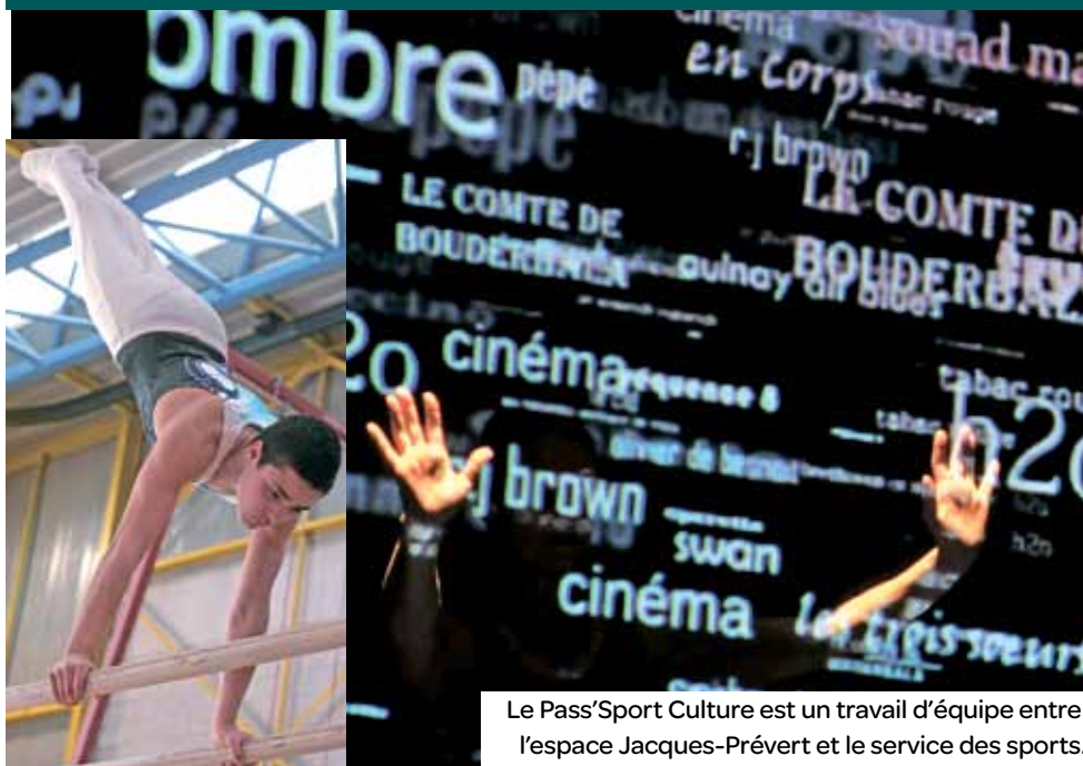
Le Pass'Sport Culture est un travail d'équipe entre l'espace Jacques-Prévert et le service des sports.