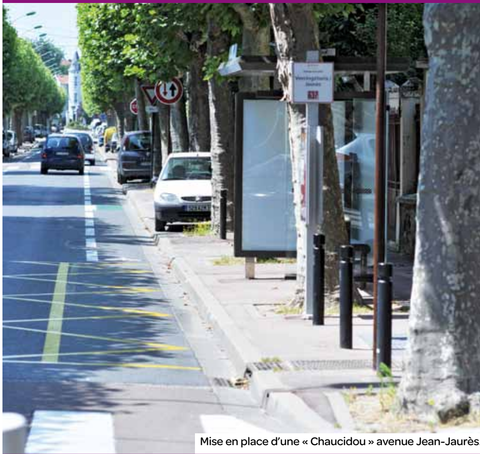
Mise en place d'une « Chaucidou » avenue Jean-Jaurès.