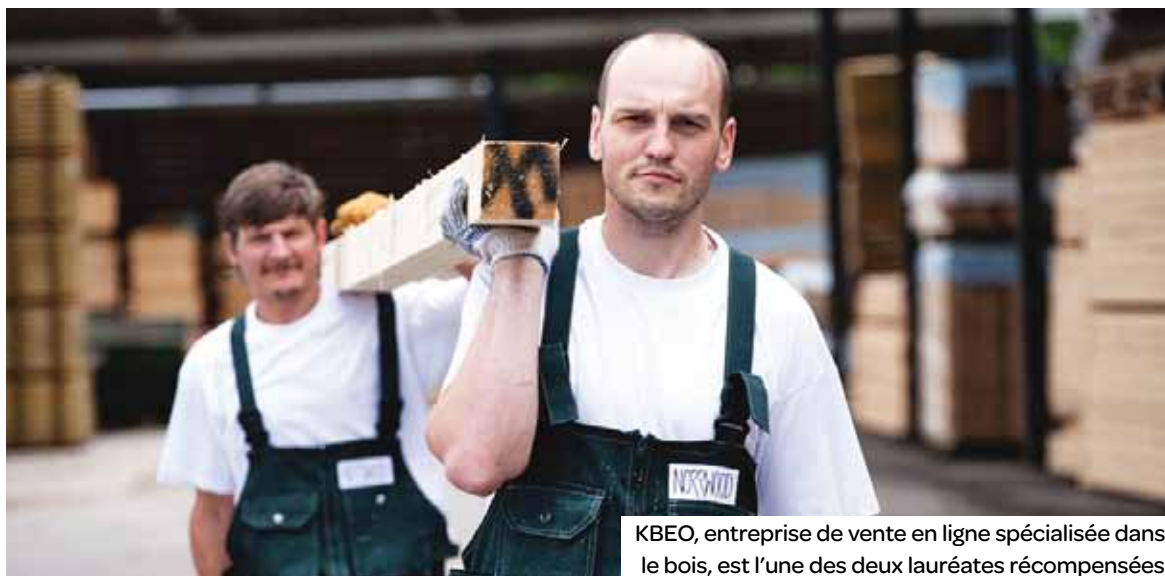
KBEO, entreprise de vente en ligne spécialisée dans le bois, est l'une des deux lauréates récompensées.