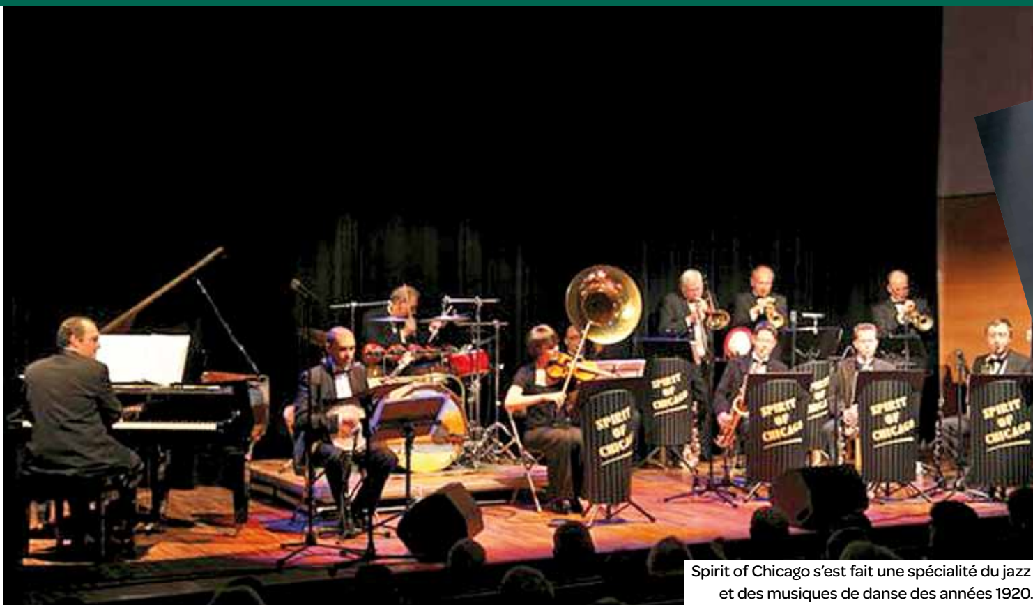
Spirit of Chicago s'est fait une spécialité du jazz et des musiques de danse des années 1920.