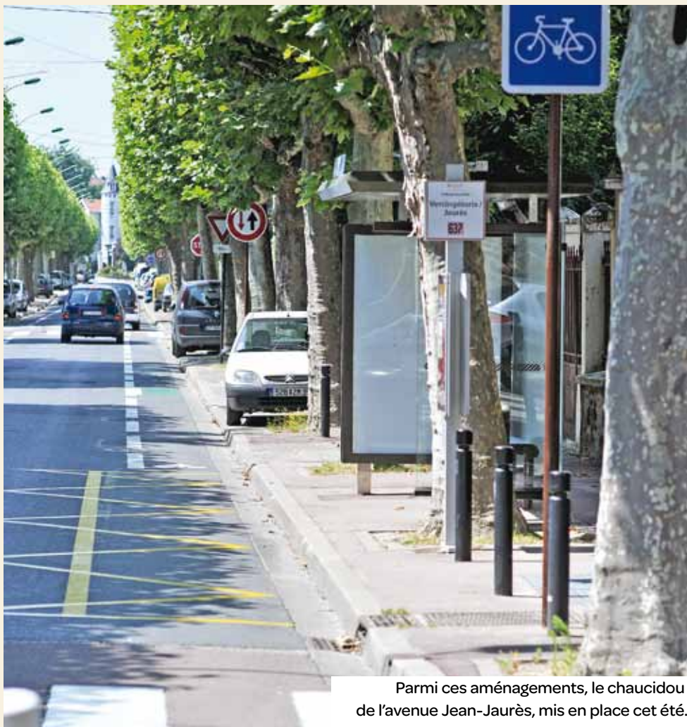
Parmi ces aménagements, le chaucidou de l'avenue Jean-Jaurès, mis en place cet été.

Suite naturelle des ateliers de concertation menés aux mois de mars et d'avril, quelques expérimentations ont été mises en œuvre par la municipalité dans le sud de la Ville, en association avec les riverains concernés.