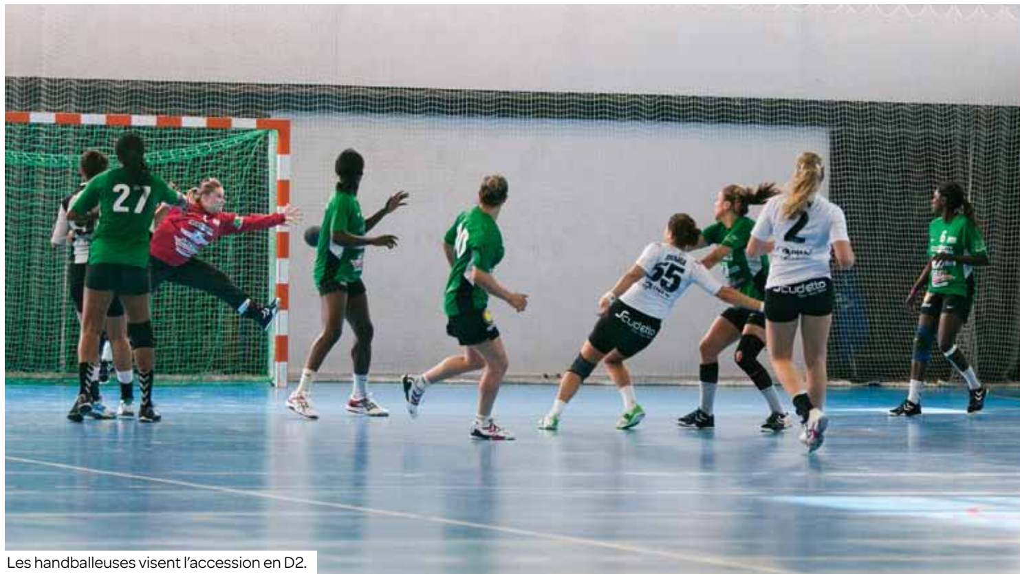
Les handballeuses visent l'accession en D2.

Les handballeuses n'ont jamais été aussi bien classées qu'en ce début de championnat en N1, confirmant ainsi l'objectif annoncé de la montée. À condition de maintenir rythme et cap en même temps.