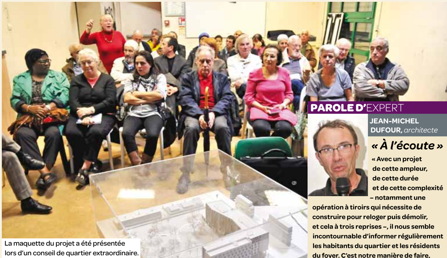
La maquette du projet a été présentée lors d'un conseil de quartier extraordinaire.

À l'invitation du conseil de quartier, les riverains de la Rose-des-Vents se sont réunis le 6 novembre pour découvrir le futur projet du foyer de travailleurs migrants.