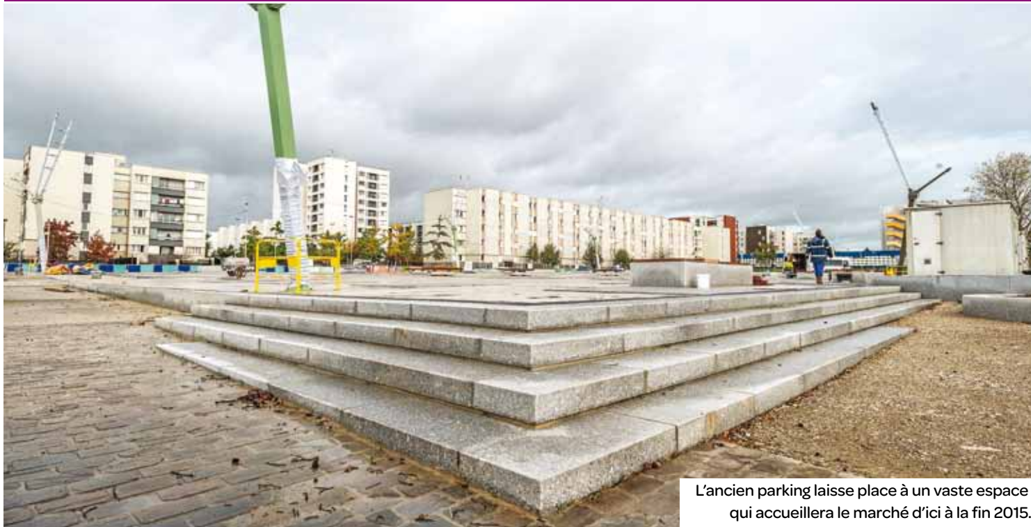
L'ancien parking laisse place à un vaste espace qui accueillera le marché d'ici à la fin 2015.