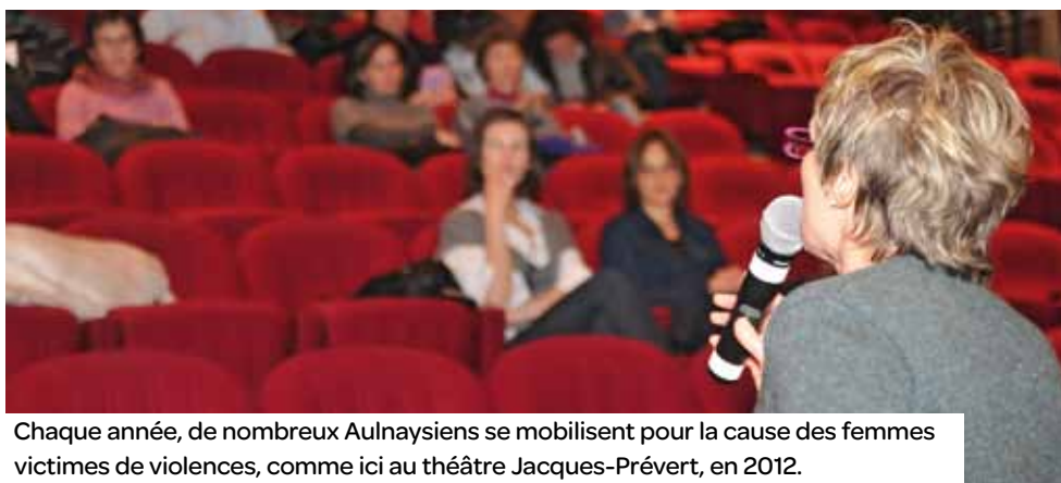
Chaque année, de nombreux Aulnaysiens se mobilisent pour la cause des femmes victimes de violences, comme ici au théâtre Jacques-Prévert, en 2012.

Dans le cadre de la Journée internationale de lutte contre les violences faites aux femmes, le Bureau d'aide aux victimes organise le 25 novembre une projection-débat autour du film saoudien Wadjda .