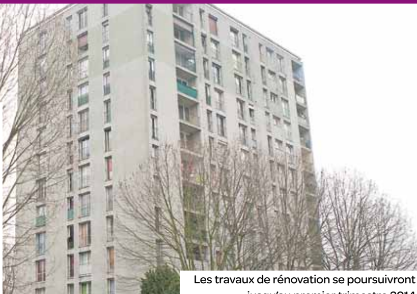
Les travaux de rénovation se poursuivront jusqu'au premier trimestre 2014