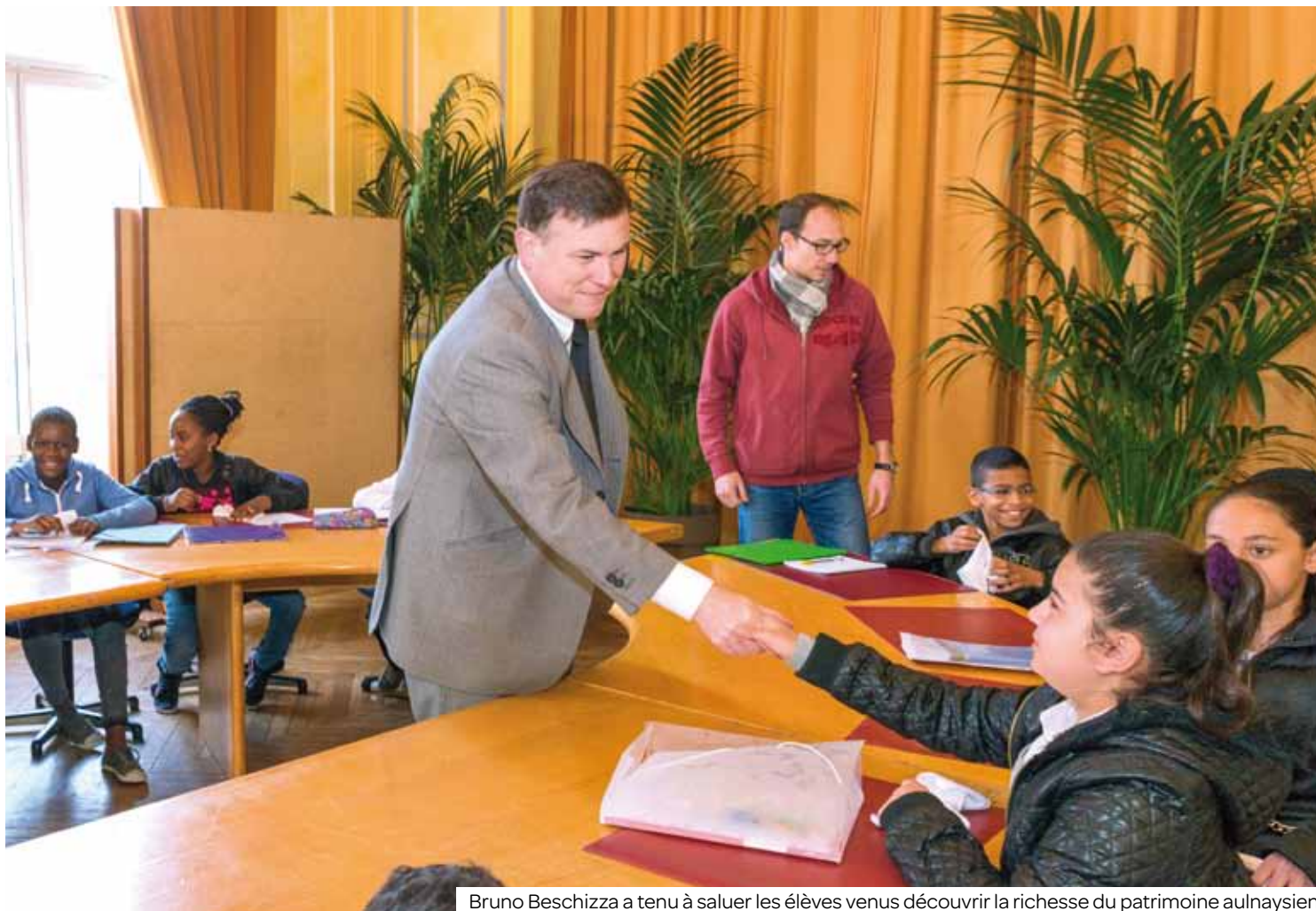
Bruno Beschizza a tenu à saluer les élèves venus découvrir la richesse du patrimoine aulnaysien.

Une classe élémentaire de l'école Croix-Rouge s'est rendue le 11 avril à l'hôtel de ville dans le cadre d'un projet mémoriel et intergénérationnel. L'occasion d'en savoir plus sur l'histoire d'Aulnay.