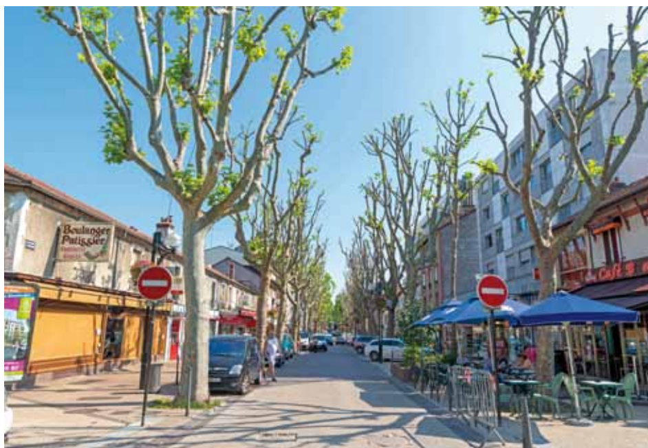
Le développement commercial est également un enjeu du PLU

L'année est décisive pour Aulnay qui entre dans une phase importante de révision de son Plan Local d'Urbanisme (PLU). Préparer Aulnay de demain se fait en plusieurs temps. Avril est donc une étape de plus dans le projet qui comporte une procédure spécifique. Explications.