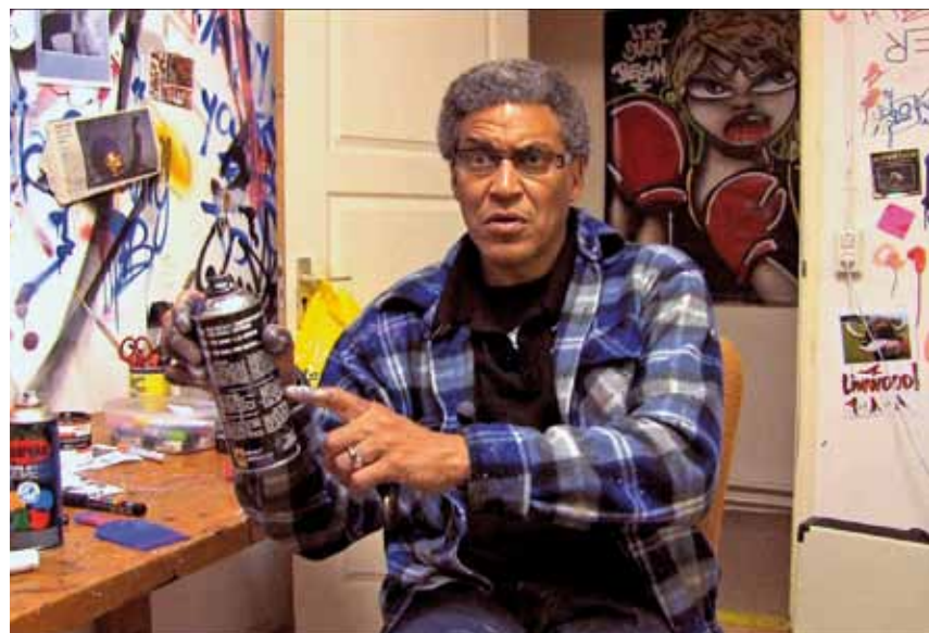
Graffiti dixit art