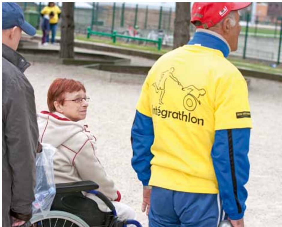
Plusieurs associations aulnaysiennes s'impliqueront dans l'intégrathlon en proposant des animations sportives.

Plusieurs associations aulnaysiennes - entre autres l'Astl, le Ca de tennis, de Cmasa lutte, la Pcca pétanque, la Fsgt - s'impliquent également bénévolement et proposeront des animations pour tous. L'Association sportive Toulouse Lautrec (Astl) se sent particulièrement concernée. « Nous sommes le club de l'Ime et tout ce qui peut faire connaître nos activités et nos sportifs, est bénéfique pour une meilleure compréhension du han-