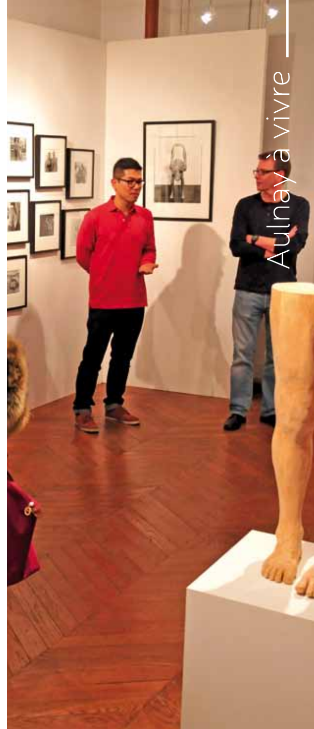
L'exposition "En dialogue"