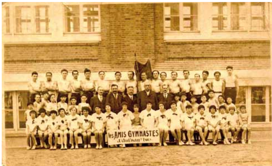
Les Amis gymnastes d'Aulnay-sous-Bois

Aulnay la sportive, avec ses équipements, sa jeunesse, son histoire, ses champions et la mémoire de ses victoires, est une ville qui, avec son amour pour le sport, a réussi à créer des rendez-vous entre Aulnaysiens, et ce, depuis bien longtemps.