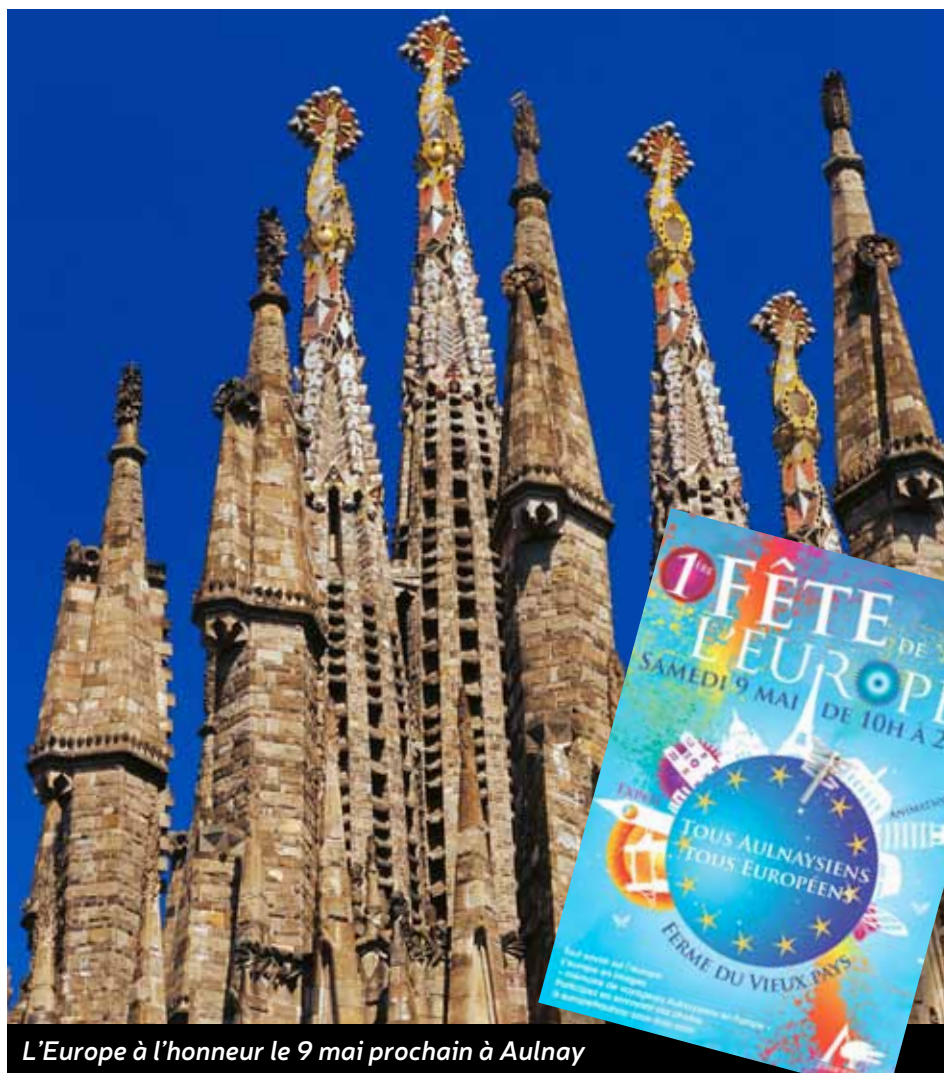
L'Europe à l'honneur le 9 mai prochain à Aulnay

Les associations concernées par les nombreux échanges culturels dans la ville seront présentes pour