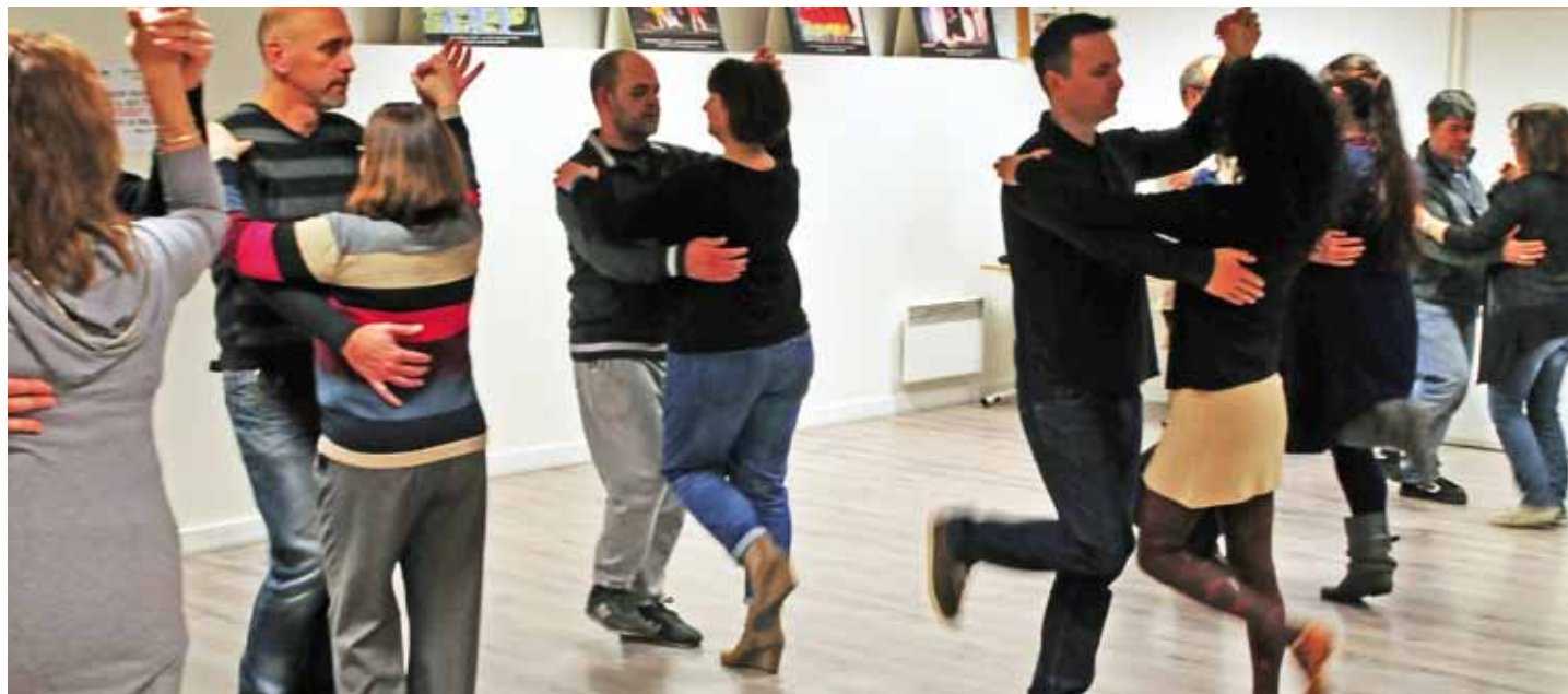
Dynamique danse 93 rassemble presque autant de femmes que d'hommes, un atout précieux pour les danses en couple.

« Dynamique danse 93 avec la fin Q.U.E, à la française s'il vous plaît... »