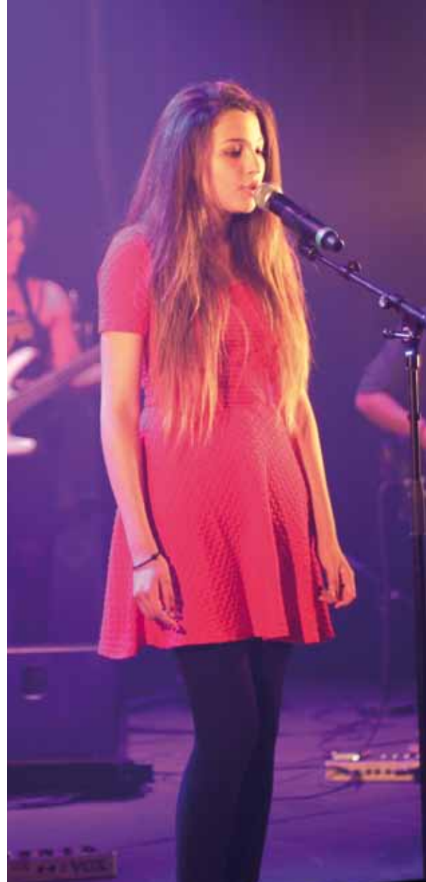
Venez découvrir Cap session