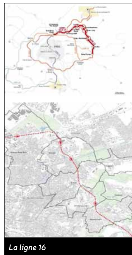
La ligne 16

Le contrat sera présenté à la population et soumis à enquête publique, Oxygène vous informera des différentes phases d'avancement.