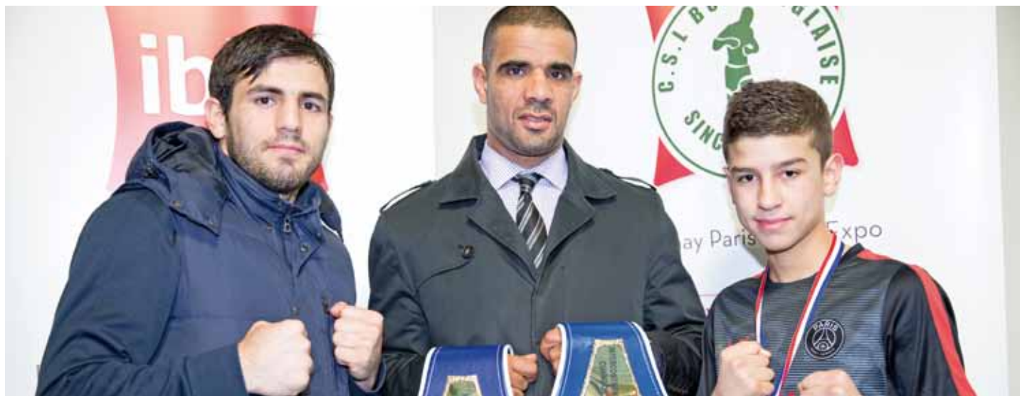
Trois champions sous un même maillot, le CSL boxe a réalisé un mois de feu avec trois générations sur des podiums nationaux et internationaux.

En l'espace de trois semaines, les boxeurs du CSL ont décroché un titre mondial et deux titres de champion de France. Un bilan cinq étoiles qui ne doit rien au hasard.