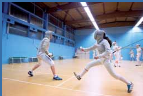
Dossier p. 13 à 17 Sportivement vôtre