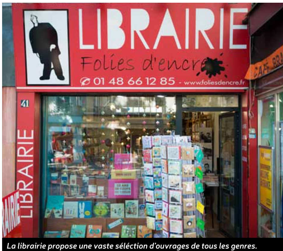
La librairie propose une vaste sélection d'ouvrages de tous les genres.

La librairie a pris ses quartiers en 2005, dans les locaux d'un magasin de meubles, au 41 boulevard de Strasbourg. Le plaisir de lire s'y partage avec passion depuis dix ans. Un anniversaire qui sera célébré le 6 juin.