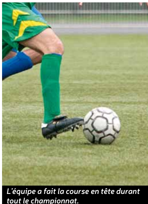
L'équipe a fait la course en tête durant tout le championnat.

Quasi invulnérables cette saison, les footballeurs de l'Espérance aulnaysienne changent de division. Une belle satisfaction mais pas une surprise.