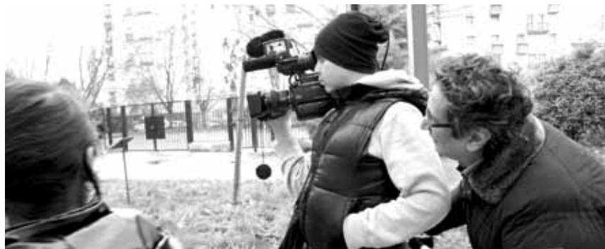
Quand les jeunes passent derrière la caméra.

Le 9 juin à partir de 18h, performance réalisée par les élèves de 4 e au cinéma Jacques-Prévert, dans le cadre de la soirée Cinéma dans tous ses états.