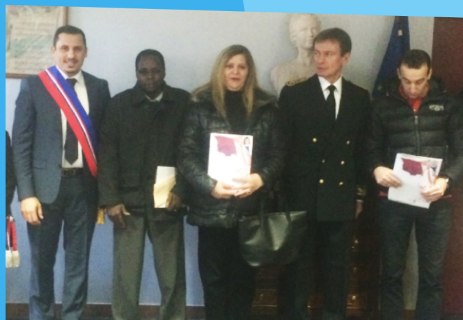
Cérémonie d'accueil dans la citoyenneté française organisée à la Sous-Préfecture du Raincy.