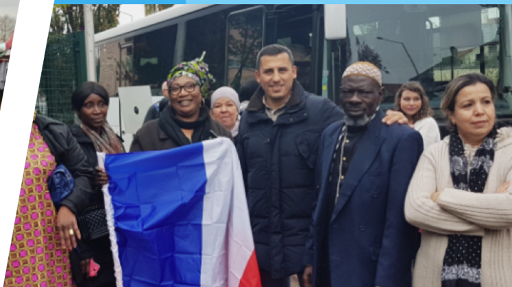
Au coté des habitants de l'Amicale « Cité de L'Europe » pour rencontrer le Bailleur Emmaüs.