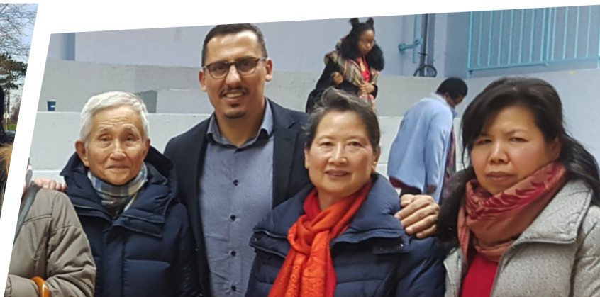
Célébration du Nouvel An chinois à Scohy.