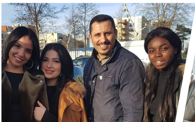
Echange avec nos jeunes sur les questions relatives à l'égalité Femme-Homme.