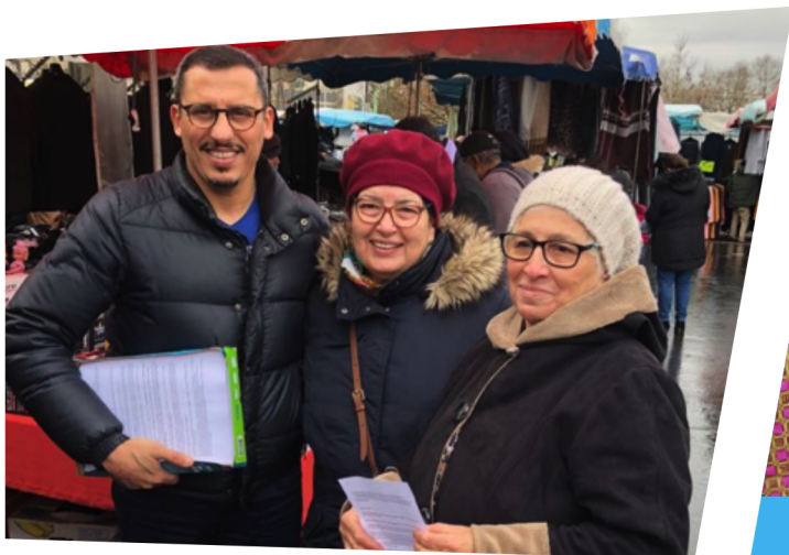
Un dimanche au marché de la Rose des Vents